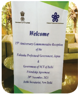
デリー準州による歓迎

昨年度は30名の生徒が参加しました。生徒は、インドの生徒に紹介したい日本のことや、聞いてみたいことをパワーポイントで、スクリーンや動画にまとめ交流しています。オンラインでの交流の