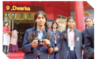
玄関前で出迎えるドワルカ校の 生徒、職員