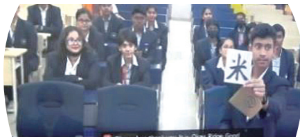
漢字クイズで盛り上がるドワルカ校の生徒

漢字を書いた紙が入った封筒を今任校長にドワルカ高校へ届けてもらった。当日その封筒を開け、書かれている漢字の読み方クイズを行った。ドワルカ高校の生徒が、結構難しい漢字も知っていて多くの漢字を