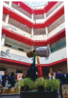
作品展示をしている ドワルカ校の中庭

ため、即席で英語を話したり、特徴的な英語に四苦八苦しなからもそれを聞き取ったりして資質・能力の向上をめざしています。昨年の11月に福岡県の大曲副知事を筆頭とする公式訪問があり、今任校長がそれに同行、公式行事としてドワルカ高校を視察しました。生徒は臨機応変に場をつなぎ見事な交流を行いました。