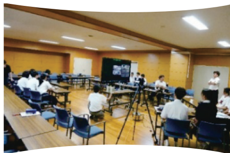
オンライン交流中の本校生徒

本校の年間行事の紹介。応援合戦を見てドワルカ高校の生徒は驚いていた。芸術が主のカリキュラムのドワルカ高校から、本校の芸術選択について多くの質問を受けた。