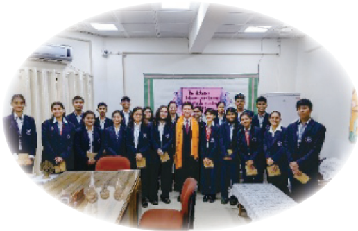
ドワルカ校生徒の歓待を受ける今任校長